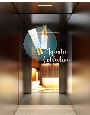
Haushahn Ahead Smart-Mirror On

Den Haushahn Ahead SmartMirror befüllen Sie ausgesprochen einfach mit Content: Über das webbasierte und benutzerfreundliche CMS stellen Sie ausgewählte Inhalte in Echtzeit und aus der Ferne auf den Screen. Für jeden Haushahn Ahead SmartMirror definieren Sie eine eigene Playlist und stimmen die Inhalte auf die Tageszeit, auf geplante Sonderaktionen oder das Wetter ab.