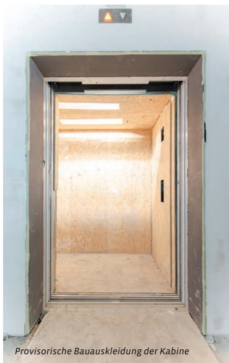
Provisorische Bauauskleidung der Kabine

Was ist ein Aufzug im Baubetrieb? Generell handelt es sich bei einem Aufzug im Baubetrieb um einen regulären Personenaufzug, der zeitlich begrenzt bereits im Baubetrieb genutzt wird. Ein solcher Aufzug muss, wie alle anderen Personenaufzüge, eine Prüfung, das so genannte Konformitätsbewertungsverfahren, durchlaufen. In der dazugehörigen Gefährdungs- und Risikoanalyse werden die besonderen Betriebsbedingungen während der Bauphase dokumentiert.