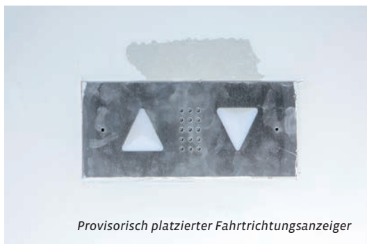
Provisorisch platzierter Fahrtrichtungsanzeiger