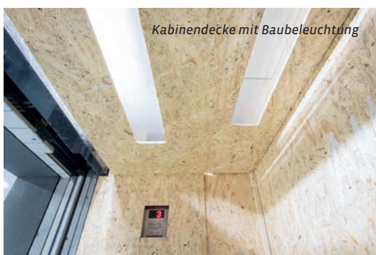
Kabinendecke mit Baubeleuchtung